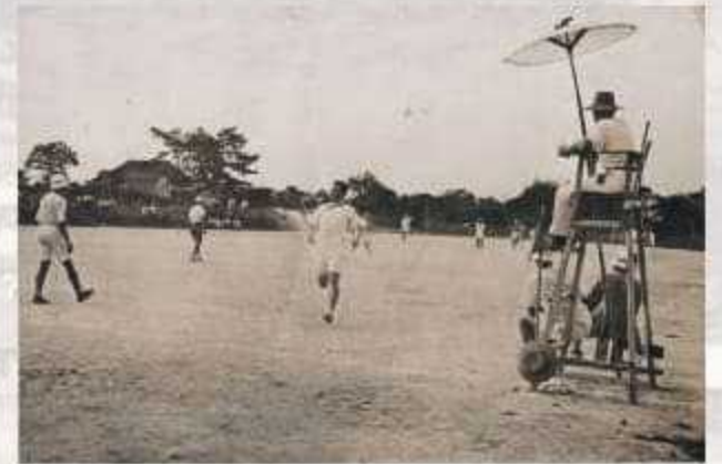
所外グラウンドでの球技