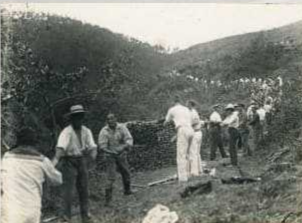
薪のバケツリレー