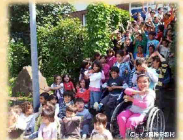
ドイツ国際平和村の子どもたち