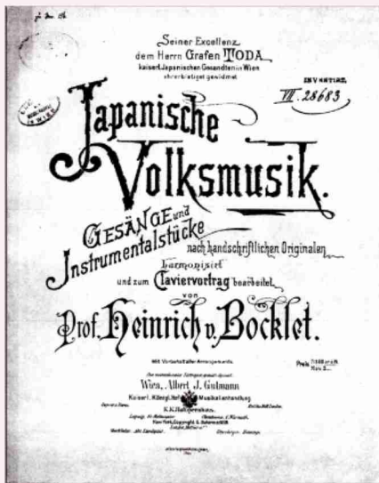
ハインリヒ・フォン・ボクレット 《日本民謡集》(1888)