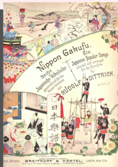
ルドルフ・ディットリヒ 《日本楽譜1》(1894)