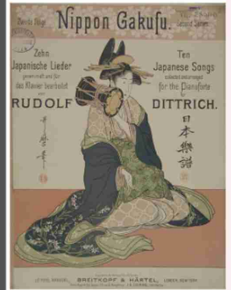
ルドルフ・ディットリヒ 《日本楽譜2》(1895)

明治時代、東京音楽学校（現在の東京芸術大学）に招かれた外国人教師ルドルフ・ディットリヒは日本の西洋発展に力を尽くしました。また彼は、日本の音楽に和声を付けて西洋に紹介しました。五線譜に書きあらわされた日本のメロディは、新しいタイプの音楽として西洋の人々の興味をひきました。