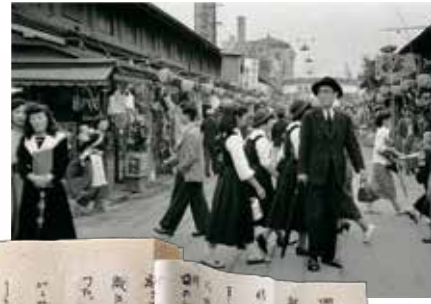
永井荷風 「瀬東綺譚」(複製)