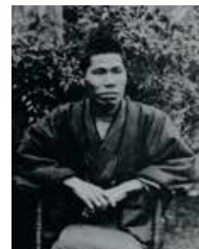
梶井基次郎 提供 日本近代文学館 「檸檬」 実践女子大学図書館蔵