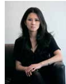
金原ひとみ 「蛇にピアス」 日本近代文学館蔵