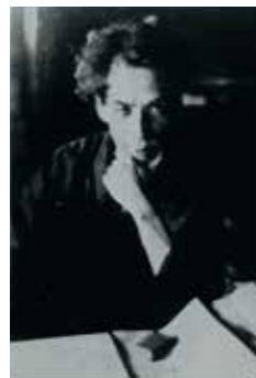
芥川龍之介 提供 日本近代文学館 「水虎晚帰之図」 日本近代文学館蔵