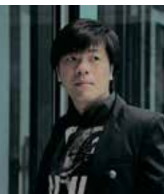
平野啓一郎 © ogata_photo 「葬送」 提供 コルケ

*申込方法……はがき・FAX・メールのいずれかにイベント名、郵便番号、住所、氏名(ふりがな)、年齢、電話番号をご記入の上、お申し込みください。当館1階受付でも申し込みます。