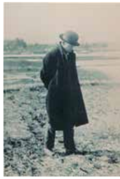
宮沢賢治 「銀河鉄道の夜」(複製)

かつて読んだ物語の一場面が、ふとした瞬間、心に浮かんだことではないでしょうか。時が経つのも忘れて、夢中で小説を読んだという経験はないでしょうか。 変わりゆく時代の中で、人間や社会の果てしない闇と、生きることの不思議に、時に苦しみ、時に喜びを見いだしながら、言葉と文体によって表現してきた作家・詩人たち。彼らがその手で触れた原稿は、作品が生まれる瞬間の息づかいを感じさせ、残された走り書きや訂正の跡は、そこへ至る複雑な思考の流れを想像させます。 開館20周年を記念した本展では、太宰治「人間失格」、三島由紀夫「金閣寺」、梶井基次郎「檸檬」など、日本文学史に燦然と輝く作家・詩人の手書き原稿46点を紹介します。生きることと思案すること、書くことと読むこと、もつとも根源にあるものを、受け取っていただければ幸いです。