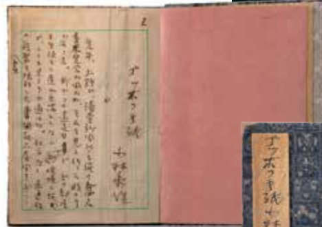
小林秀雄 提供 新潮社 「ゴッホの手紙」 提供 株式会社宇野千代