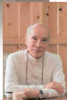
谷川俊太郎 「二十億光年の孤独」