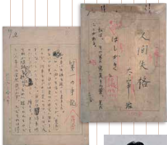
太宰治 提供 日本近代文学館 「人間失格」 日本近代文学館蔵

20th Anniversary Literary Special Exhibition