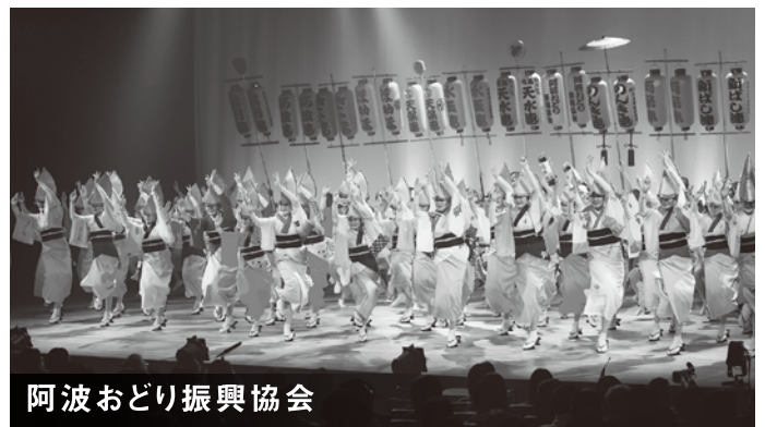
阿波おどり振興協会

昭和44年の発足。協会には踊り子の個性を尊ぶ気風があり、これまでに数多くのスター踊り子を輩出した。バリエーション豊かな踊りやお囃子で観客を楽しませる。徳島支部をはじめ県下に8つの支部があり、協会全体では50を超える連が所属している。