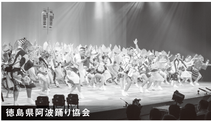
徳島県阿波踊り協会

昭和44年の発足。協会には踊り子の個性を尊ぶ気風があり、これまでに数多くのスター踊り子を輩出した。バリエーション豊かな踊りやお囃子で観客を楽しませる。徳島支部をはじめ県下に8つの支部があり、協会全体では50を超える連が所属している。