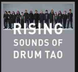
RISING SOUNDS OF DRUM TAO

2017年ユニバーサルミュージックよりメジャーデビューCD、「RISING-SOUND OF DRUMTAO-」を発売。iTunesジャパン・ワールドアルバムランキング1位獲得! iTunesシンガポール総合アルバムランキング1位、その他3ヶ国のiTunesワールドチャートでTOP3入りを果たす。