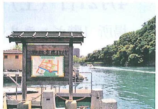
助任川の寂聴棧橋