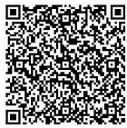
スマートフォン用

徳島県ホームページ内で「オーケストラ」と検索、または下のQRコードからアクセスしてください。