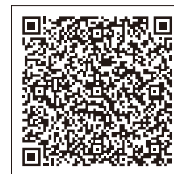
スマートフォン用