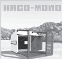
つみ木[株式会社伸ホーム]