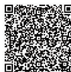
スマートフォン用

♪ 徳島県ホームページ 徳島県 HP 内で「オーケストラ」と検索、 または下の QR コードからアクセスしてください。