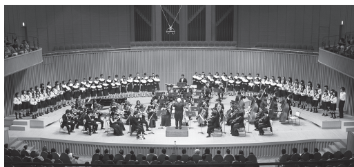
徳島文理大学むらさきホール

世界最高水準の音楽ホール。2007年7月、学園創立110周年記念として、文理大学徳島キャンパスに誕生。総面積約6,080㎡、客席1,314席の規模を誇ります。世界で4番目の設置となった大型キャノピー（可動式音響反射板）を持ち、これを上下に移動させることで残響音を調整し、最適な音響効果が得られます。