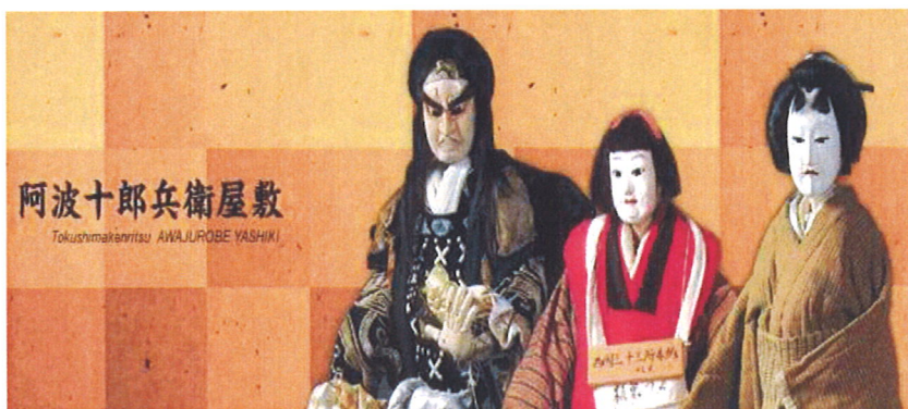
阿波十郎兵衛屋敷 Tokushimakanritsu AWAJUROBE YASHIKI

7月18日(土) 10:30~11:45 演目解説などのご案内をいたします。 ぜひ、お越しください。