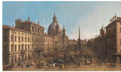
カナレット (ジョヴァンニ・アントニオ・カナル) (ローマ、ナヴォーナ広場)