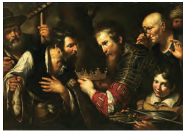
ペルナルド・ストロツィ (アブドロミノに奪った王冠を返還するアレクサンドロス大王)