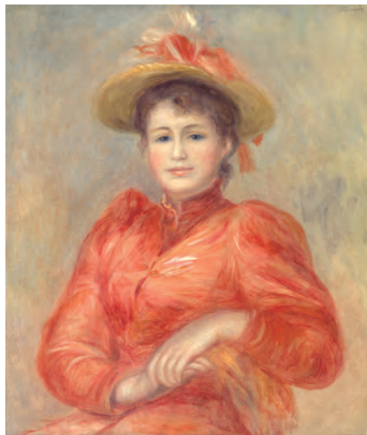
ビエール＝オーギュスト＝トルノワール (赤い服の女)