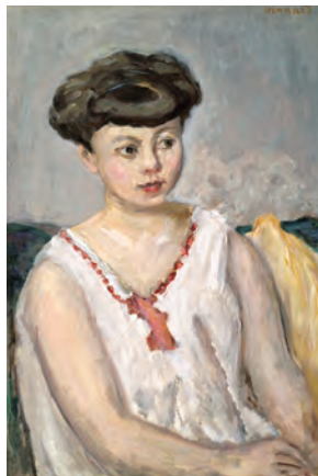
ビエール・ボナール (若い女)