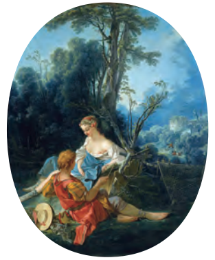
フランソワ・ブーシェ (田圃の気晴らし)