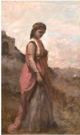
ジャン・バティスト・カミーユ・コロー (ユディト)