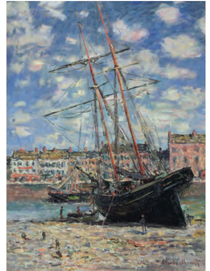
クロード・モネ (海辺の船)