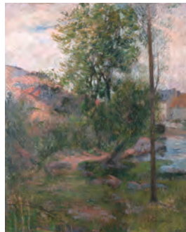
ポール・ゴーガン (水辺の柳、ボンタヴェン)