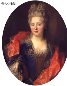
ニコラ・ラルジエール (若い婦人の肖像)