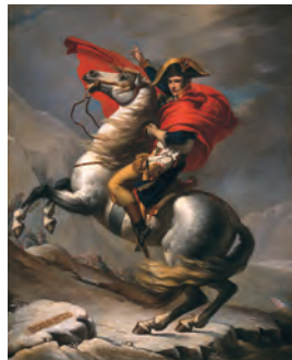
ジャック＝ルイ・ダヴィッドの工房 (サン＝ペルナル時を越えるボナパルト)