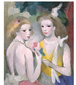
マリー＝ローランサン (二人の女) ●ADAGP,Paris & JASPAR,Tokyo,2015 X0024